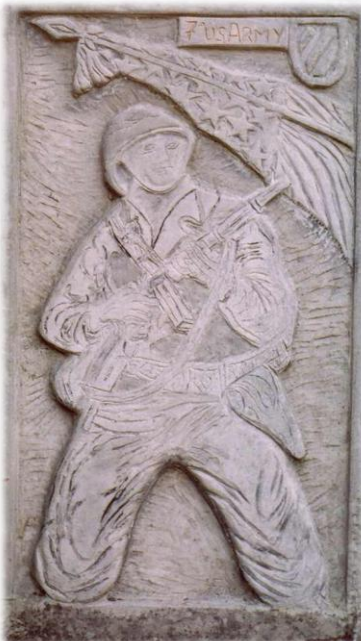
Plaque at the Cemetery