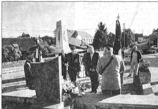
■ Moment de recueillement.