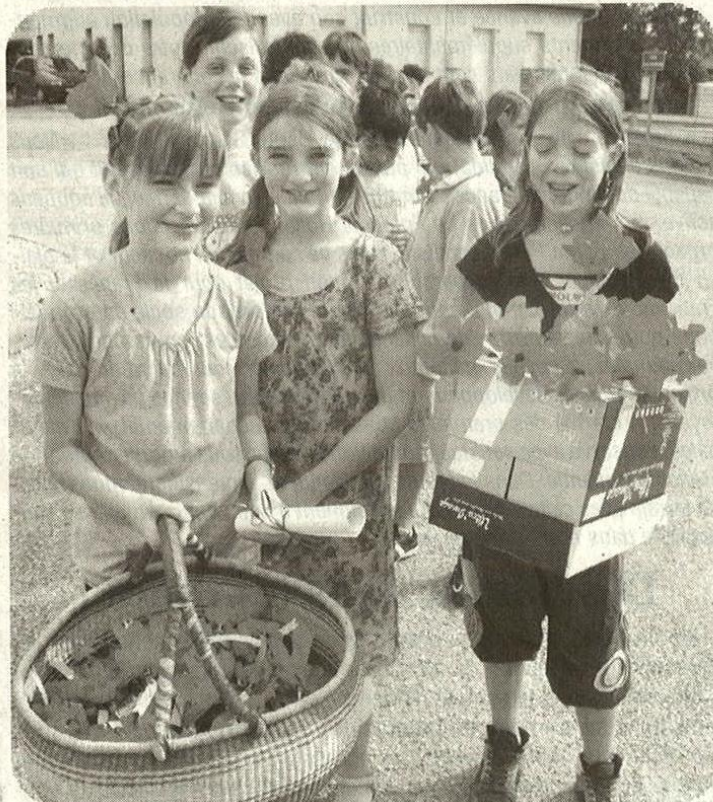
Les enfants ont remis fleurs et message de remerciements aux anciens combattants américains