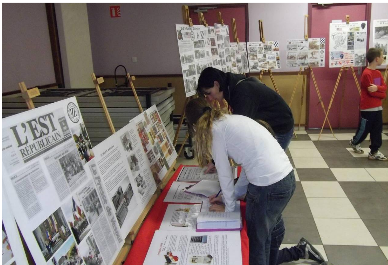
The children of Mailleroncourt Charrette, Servigny, Genevrey, Flagy, Varogne, Neurey en Vaux, La Villeneuve