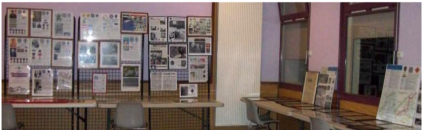
In Memory of the American soldiers who gave to us Freedom ! A la mémoire de nos Libérateurs Américains !