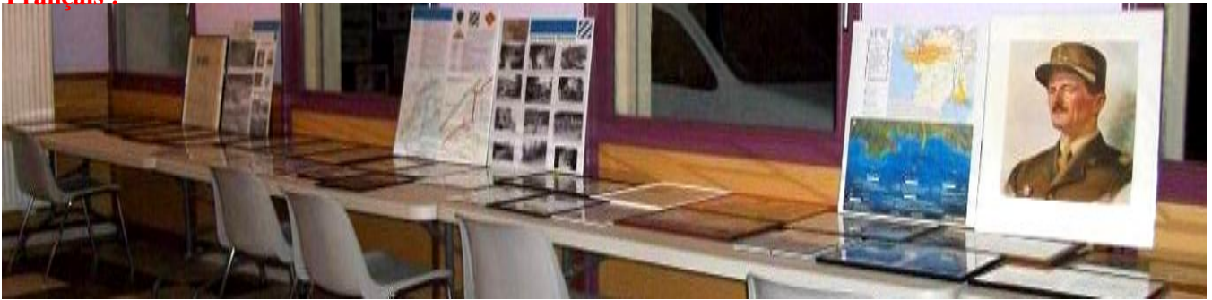
In Memory of the French Soldiers