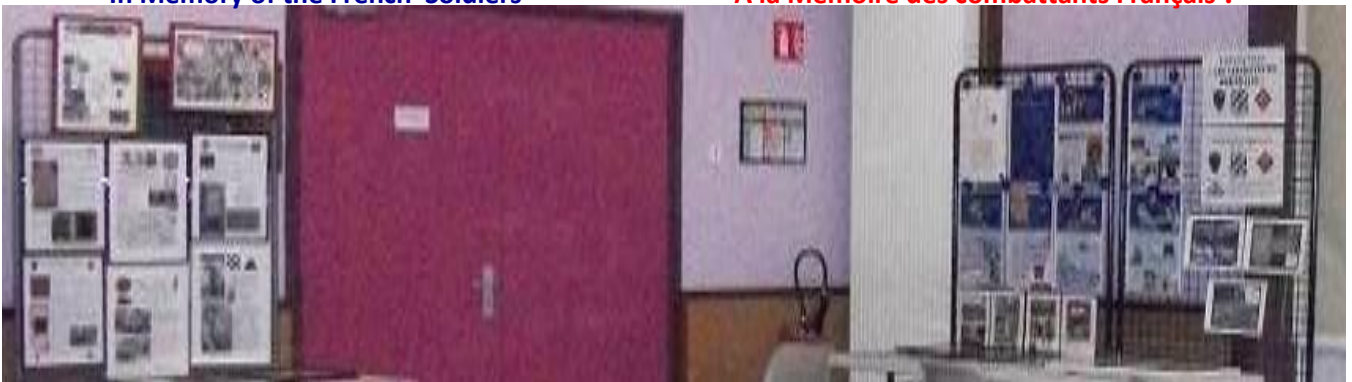
A la Mémoire des combattants Français !