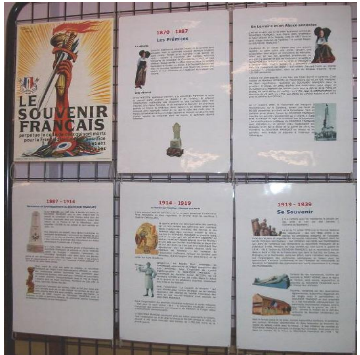
The work of the « Bleuets de France (National Office for the Ex-Servicemen of France) and the work of the « Society of the French Remembrance »... L'œuvre du Bleuets de France et le Travail du Souvenir Français !